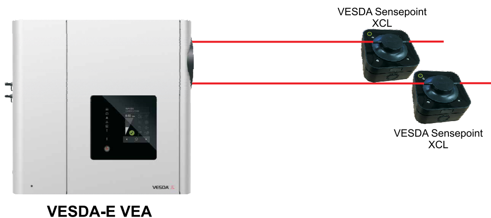
VESDA Sensepoint XCL与VESDA-E VEA相连