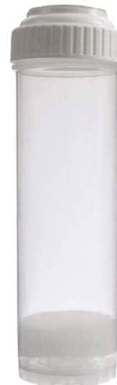
(ii) Cartouche rechargeable pour boîtier de filtre standard de 10"