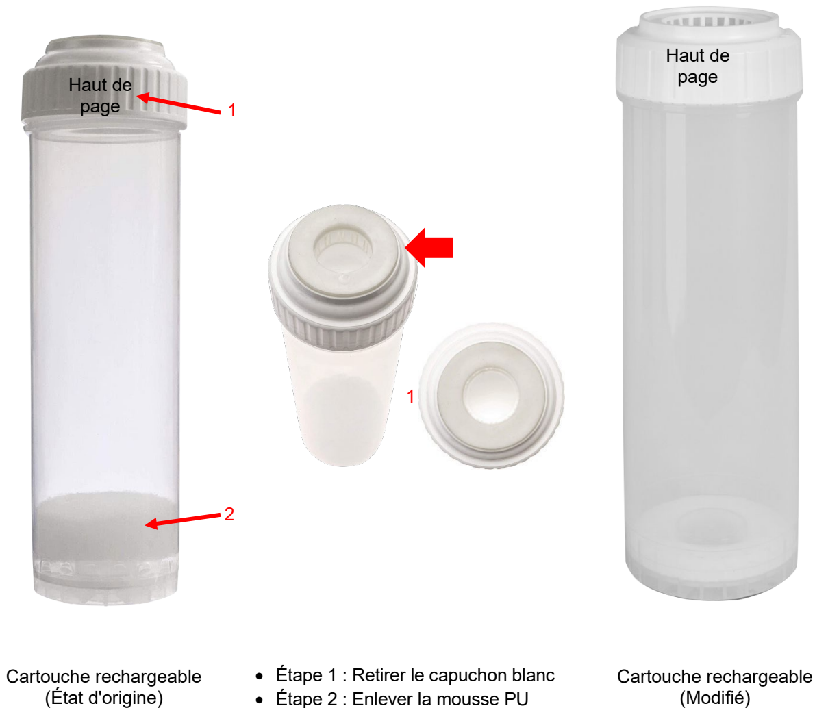
Cartouche rechargeable (État d'origine)