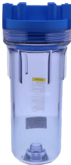
(i) Boîtier de filtre standard de 10"

La figure 1 montre un exemple de filtre chimique assemblé à partir de pièces disponibles dans le commerce (tableau 1) comprenant (i) un boîtier de filtre standard de 10 pouces et (ii) une cartouche rechargeable.